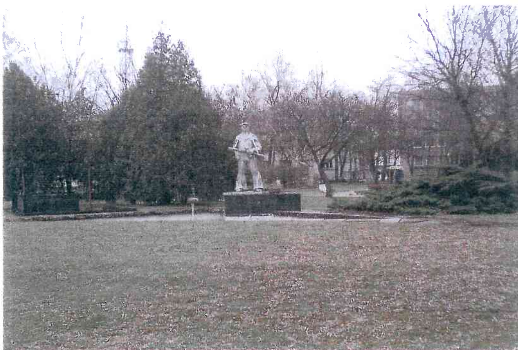
Pohľad na fontánu