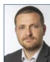
Őrs Orosz Volebný obvod č. 3. Aliancia-Szövetség (970 hlasov)