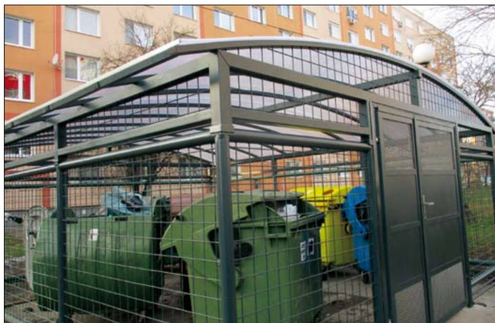
Rekonštrukcia, zakrývanie a uzatváranie kontajnerových stanovišť je prioritou mesta aj v tomto roku.

Najvýznamnejšou zmenou v odpadovom hospodárstve je, že od 1. marca