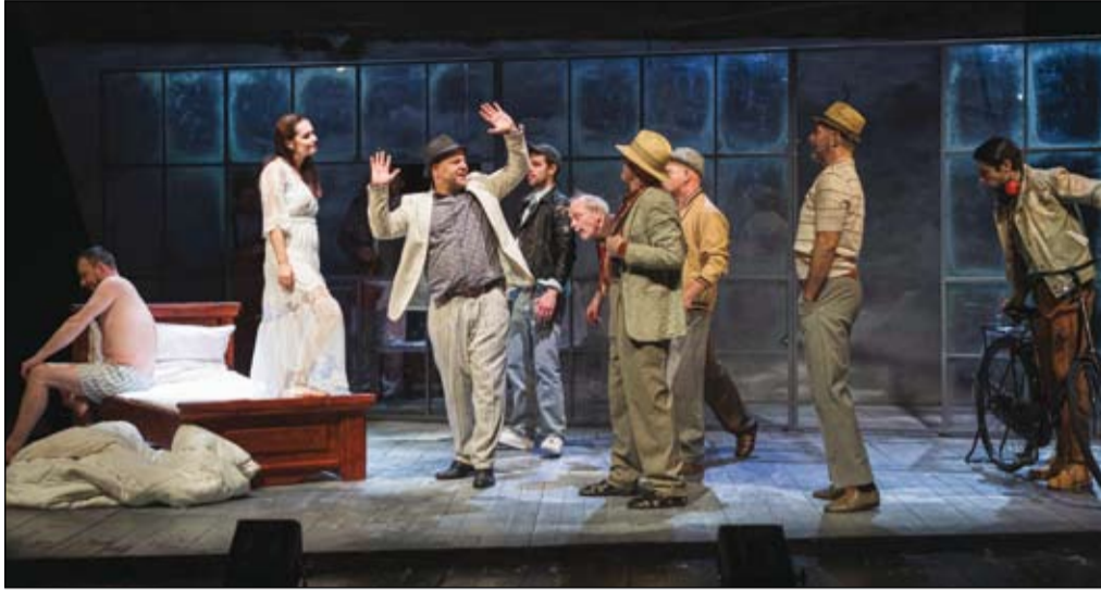
A Magyar Színházak Kisvárdai Fesztiválján az Úri muri című előadással szerepelt a színház társulata

A 2024/25-ös évadot Színezd újra! – Klasszikusok mai szemmel mottóval hirdette meg a Komáromi Jókai Színház: újraértelmezett, újraszí-