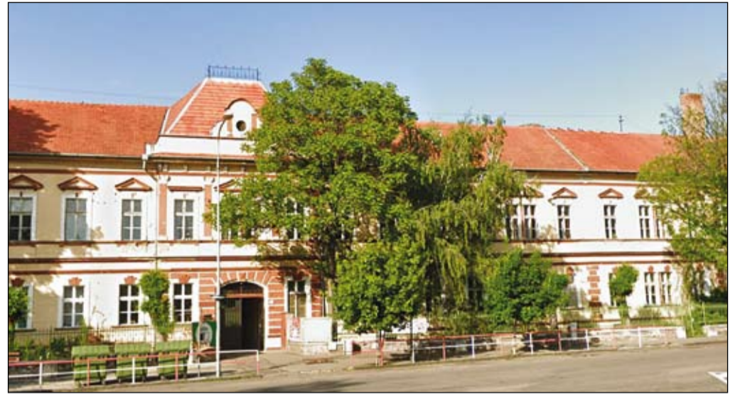
Na veľkú rekonštrukciu čaká Základná škola na Pohraničnej ulici v hodnote približne 2,8 milióna eur

Naše materské a základné školy majú väčšie či menšie dvory a športoviská. Aj o tie je postarané. Pokračuje