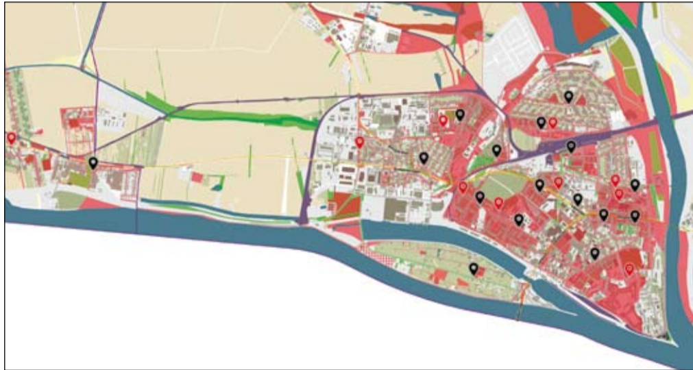
Jelmagyarázat: fekete – 2018-tól elérhető konténerek, piros – szeptembertől elérhető konténerek

Ez azért is fontos, mert 2025 januárjától újabb feladatot kapnak az önkormányzatok; kötelező lesz a textil hulladék szelektív gyűjtése. Az új feladat biztosítására az önkormányzatok pénzt nem kapnak és az ezzel kapcsolatos irányadások is egyelőre még pontatlanok. Városunk polgárai azonban már több éve válogatják a textil hulladékot a Humana konténerekbe. Ezidáig 20 konténerben lehetett a textil hulladékot elhelyezni, köztük a külvárosi részeken is, így Kaván, Gyulamajoron, Gadócon és Őrsújfalun.