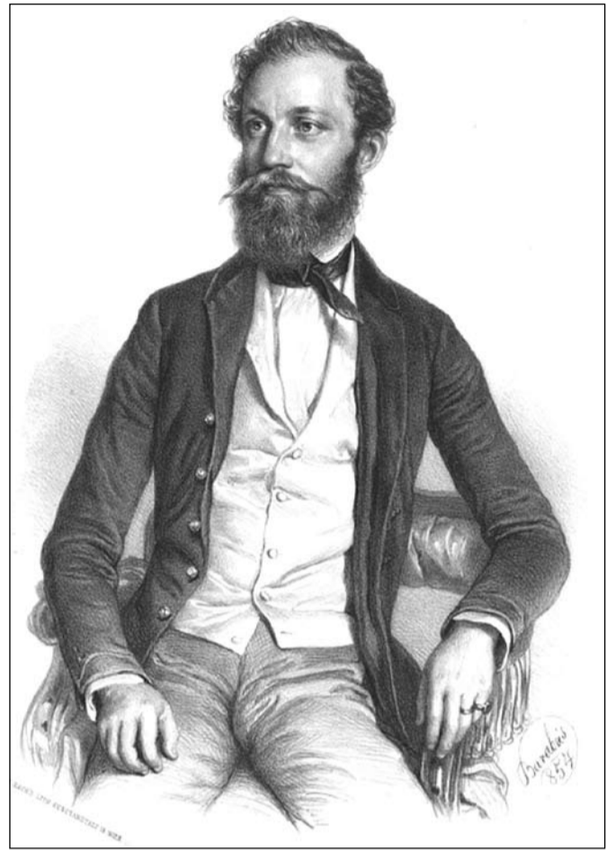
Jókai Mór; Barabás Miklós litografiája 1854-ből

Jókai Mór emlékezete nemes kötelezettséget jelent minden magyar ember számára és ránk, komáromiakra ez hatványozottan érvényes. A város és polgárai kötelessége tisztelettel megőrizni halhatatlanságát, biztosítani emlékének mindenkor megbecsülését, hiszen ő az egyetemes magyar irodalomnak szerzett világszerte dicsőséget, mondhatjuk, hogy ő a magyar irodalomnak és világirodalomnak is fényes csillaga. Már 1925-ben, a századik születésnap ünne-