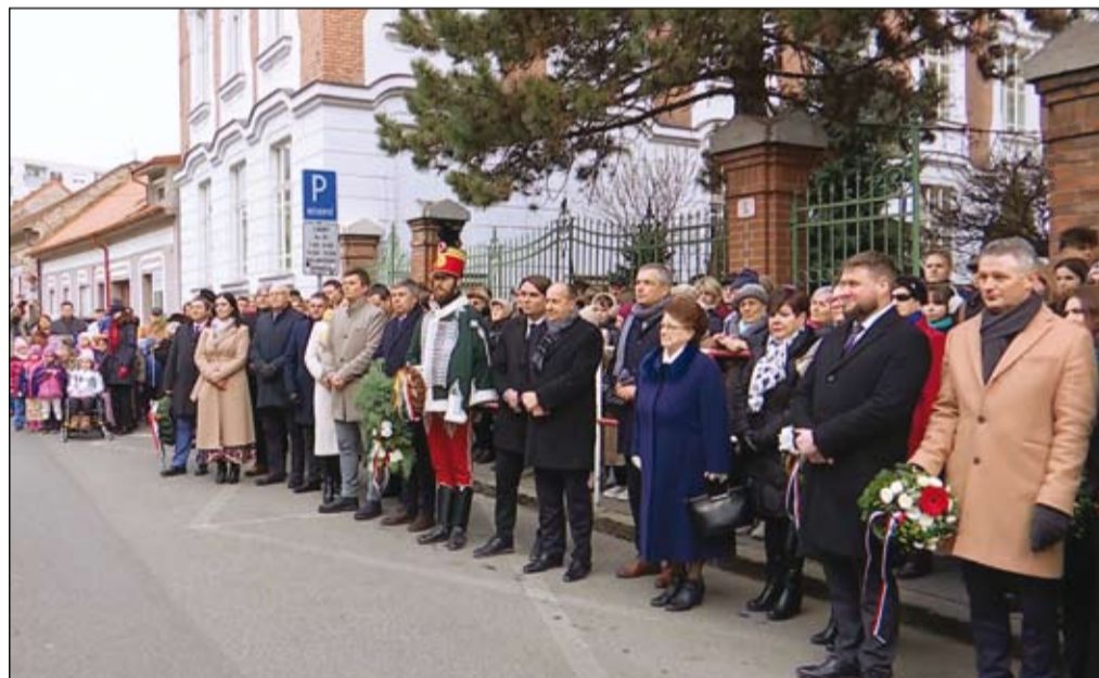
Jókai Mór egykori szülőháza helyén álló épület előtt tartott megemlékezés résztvevői